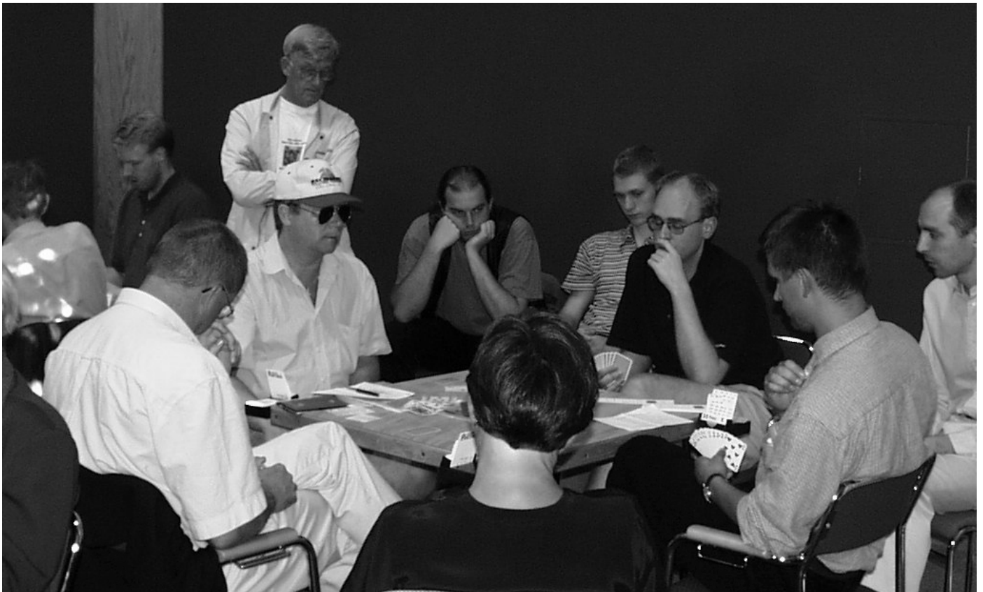
Många bakblåsare vid bord ett, som vanligt

Löparn sätter sig vid bordet och en viss stämning sprider sig.